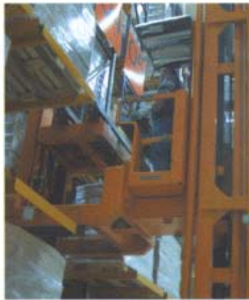
Im CEPL-Logistikzentrum werden über den Wareneingangsbereich auch Waren ausgelagert. Im Hochregallager wird auch kommissioniert.

Durch den konsequenten Einsatz des SLS-NT-Systems der Comas GmbH haben die Betreiber des Logistikzentrums alle Vorgänge der Lo-