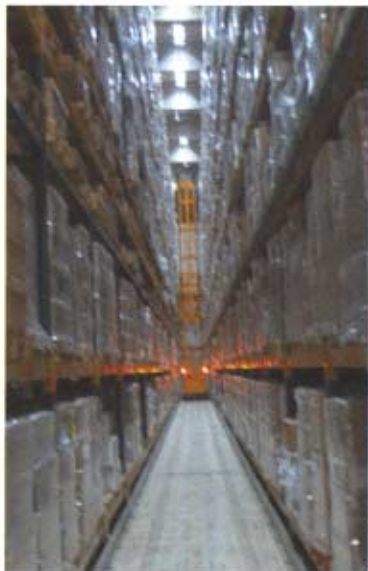
Jeder Gangwechsel kostet Zeit und verursacht dadurch hohe Kosten.

bedingungen (Lieferversprechen, ungeplanter Materialbedarf oder Ähnliches) erfüllt werden.