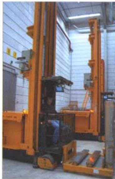
Aus den unteren Regalfächern kann mit den Hochregalstaplern nicht kommissioniert werden – dafür müssen Handkommissionierfahrzeuge eingesetzt werden.

Problematisch wird diese Art der Disposition, wenn dem Kunden die Möglichkeit eingeräumt wird, über eine Administrationsfunktion einzelne Aufträge zu priorisieren. Damit können dann bestimmte Rand-